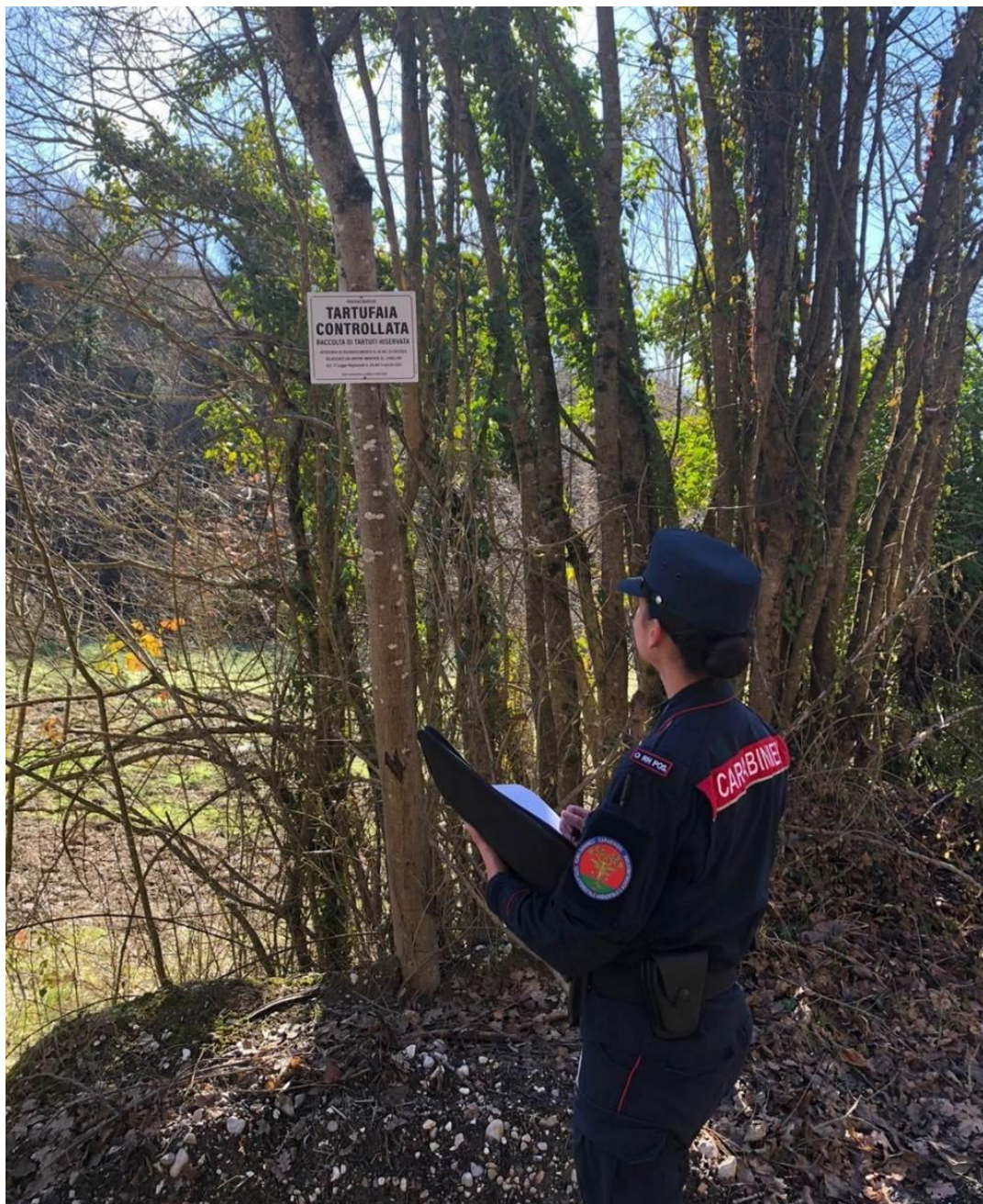
Tartufaia controllata con tabelle in posizione non conforme

Gli illeciti amministrativi accertati sono stati relativi alle prescrizioni per la ricerca e raccolta tartufi vietata in alcuni periodi e in alcuni orari, per utilizzo di mezzi non consentiti, per il mancato versamento della tassa di concessione regionale, per l'uso di più di due cani nella cerca, per l'apposizione di tabelle su tartufaie non autorizzate o in modalità non conforme. Durante lo svolgimento delle suddette attività, sono state effettuate anche delle verifiche volte all'accertamento dell'iscrizione dei cani da cerca dei tartufi all'anagrafe canina.