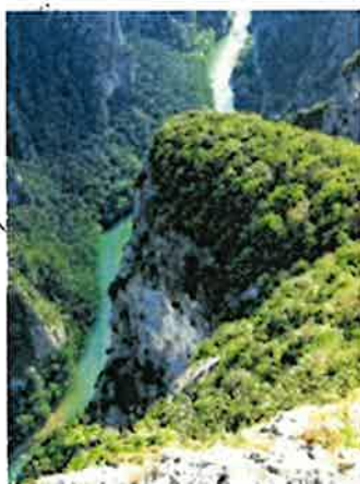
Fiume Candigliano - Gola del Furlo